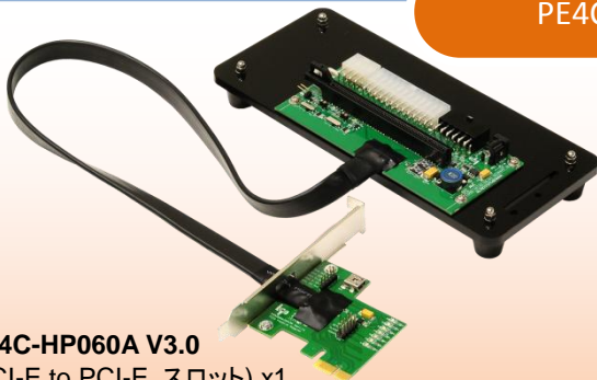
PE4C-HP060A V3.0 (PCI-E to PCI-E スロット) x1