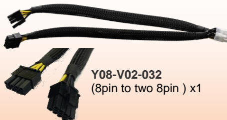
Y08-V02-032 (8pin to two 8pin) x1