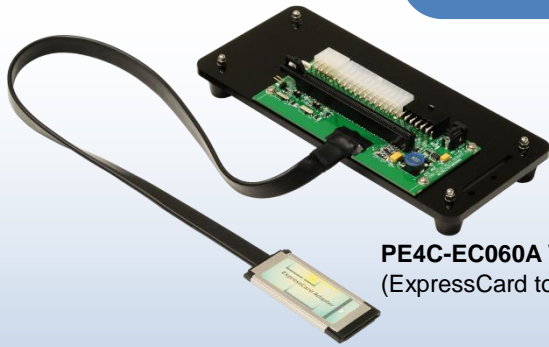
PE4C-EC060A V3.0 (ExpressCard to PCI-E スロット)