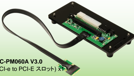
PE4C-PM060A V3.0 (mPCI-e to PCI-E スロット) x1