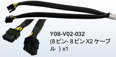
Y08-V02-032 (8ピン-8ピン X2 ケーブル) x1