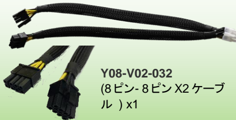
Y08-V02-032 (8ピン-8ピン X2 ケーブル) x1